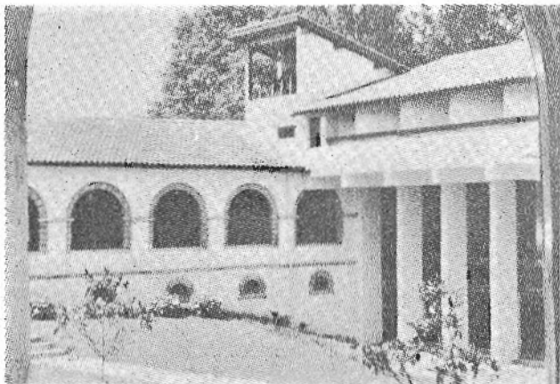
Bellok, Beneditarren Monastegia, otoitz eta euskera eskola

Euskerazaintza'ren elburua, euskalkiak indartzea, agertu geuntsanean zerbait ba-ekiala eta alkar «urbil-tzeko» bideak artu bear ziralara esan euskun, batez be. Geroago joatea nai eban, astiroago berba egiteko, baiña geuk be egun betea geunkan eta ezin genduan gerorako itzi alkar-izketa luzeago ori. Maitekero agur egin eta geure bideari jarraitu geuntsan.